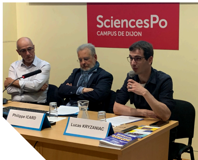
TABLE-RONDE : La citoyenneté européenne en question

Le 16 mai, la Maison de l'Europe, en partenariat avec le Centre de Recherche en Droit et Sciences Politique (CREDESPO) de l'Université de Bourgogne, organisait une table ronde sur la réforme des migrations. Au menu : le contrôle renforcé aux frontières, la solidarité entre Etats membres de l'Union européenne, la fin programmée de Dublin III, entre autres. L'événement a réuni une quinzaine de personnes.