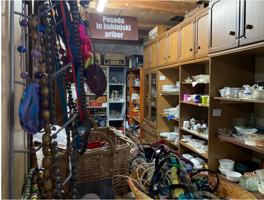
Ressourcerie Slovenske Konjice