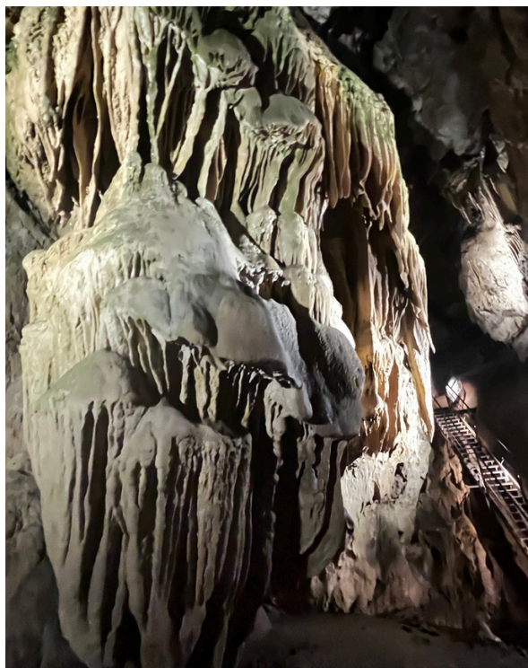
Stalactites en formation