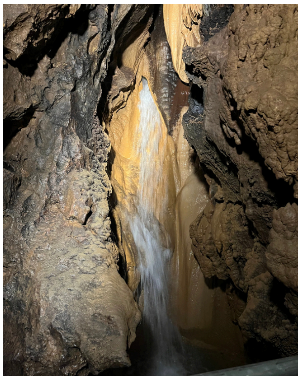
Cascade de la rivière souterraine

La grotte de Jama Pekel est située à une vingtaine de minutes de Celje. C'est un site naturel protégé, notamment par l'Union européenne, grâce au réseau Natura 2000 car elle abrite un écosystème unique. En déambulant dans ses galeries, il est possible de voir de multiples stalactites et stalagmites, créées grâce à l'écoulement de l'eau, des escaliers et passerelles permettent de circuler au-dessus de la rivière souterraine ayant creusée la grotte et en levant la tête, on peut observer des chauves-souris se reposant. Chaque année environ 15 000 visiteurs découvrant la grotte de Jama Pekel et malheureusement, le tourisme de masse perturbe cet écosystème... Les parois de la grotte verdissent car les lumières disposées, afin d'éclairer le chemin, ainsi que la respiration humaine permettent à la mousse et aux microorganismes de proliférer. Ce type de problème est visible dans toute l'Europe, comme par exemple en France, dans la grotte d'Osselle, en Bourgogne-Franche-Comté. Afin de ralentir la dégradation de notre écosystème, l'Union européenne a mis en place le réseau Natura 2000 qui protège ces sites uniques.