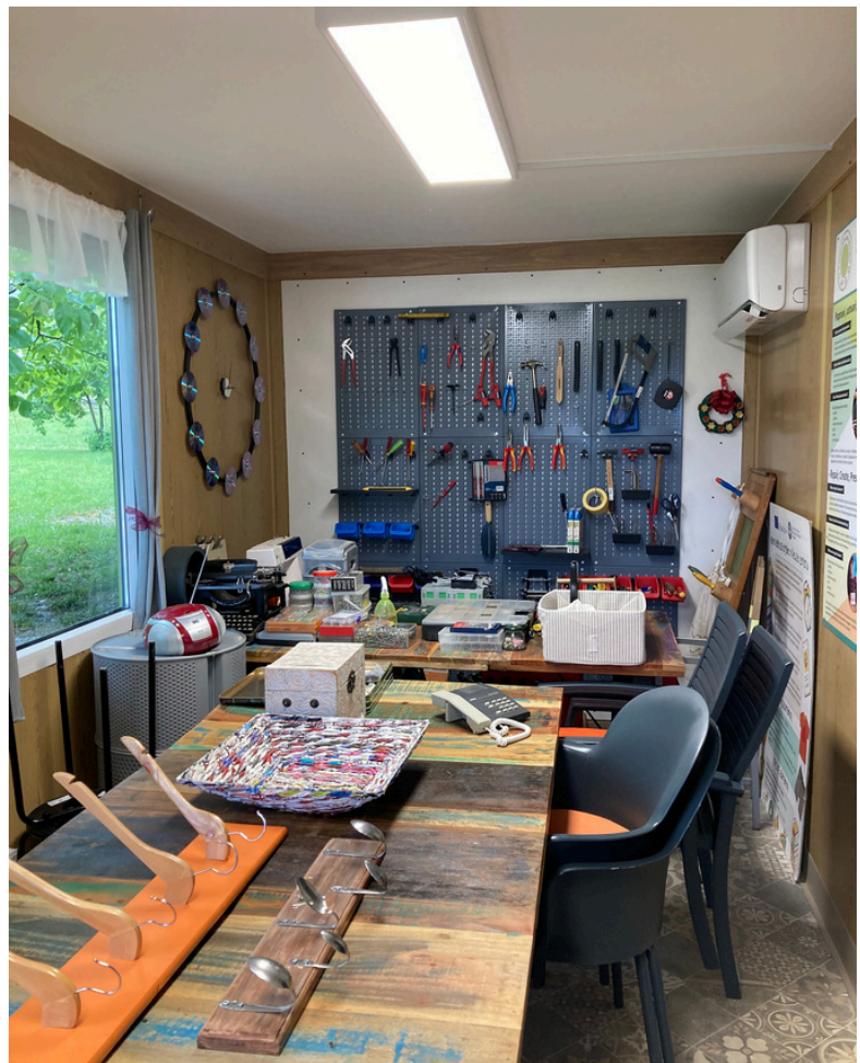
Le Repair Café

Une ressourcerie a pour objectif de réduire les déchets en donnant une seconde vie aux objets, vêtements récupérés... Ces articles sont triés, réparés, nettoyés puis revendus dans une démarche d'économie circulaire en favorisant la réutilisation plutôt que le gaspillage. Ces structures, souvent organisés sous formes d'associations, sont des entreprises privées a but non lucratif participant a l'insertion sociale. Les personnes travaillant dans cette ressourcerie sont majoritairement des personnes en situation de handicapé ou en réinsertion sociale. En plus d'être utile pour la société, les ressourceries contribuent à la protection de l'environnement grâce au recyclage de matières premières et à la diminution de la pollution.