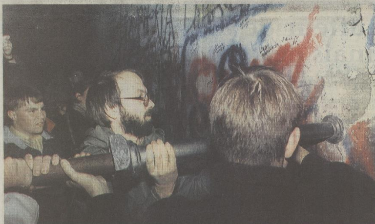
Pendant ce week-end fou, chacun voulait casser son petit bout de mur

La journée de dimanche a de nouveau été placée sous le signe de la folle pour tous les Allemands, de l'Est comme de l'Ouest, et plus particulièrement pour les Berlinois : les deux maires de la ville divisée se sont serrés la main, le président ouest-allemand Richard Von Weizsäcker a fait quelques pas à l'Est, et le parti communiste est-allemand, le SED, a annoncé un possible congrès extraordinaire pour le mois prochain. Le flux ininterrompu des Allemands de l'Est a provoqué des embouteillages monstres dans toute la RFA : plus de deux millions d'Allemands de l'Est ont franchi la frontière dimanche (et un million d'entre eux pour le seul Berlin-Ouest), selon les autorités ouest-allemandes, deux millions de visiteurs qui s'ajoutent aux 1,3 million de samedi. Et les autorités ouest-allemandes ont tamponné environ 4,3 millions de visas de jeudi soir à dimanche : ce qui fait qu'un quart de la population de RDA (16,6 millions d'habitants) possède désormais un visa de sortie.