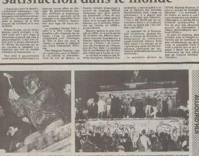
Symbolique : ce jeune Allemand casse avec un marteau un morceau du mur de la Hohen.

« Grand jour pour la liberté », a déclaré un représentant de l'Organisation mondiale de la Santé. Il a également déclaré qu'il était « très libéré » en Allemagne de l'Est. Il a également déclaré qu'il était « très libéré » en Allemagne de l'Est.