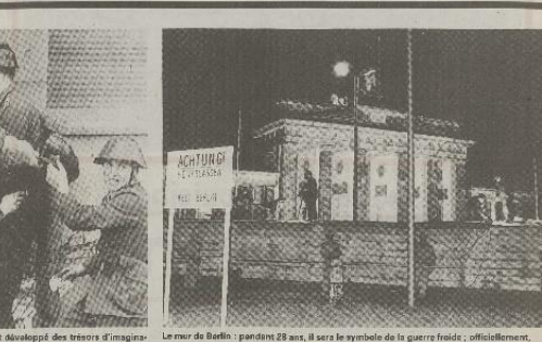
Le mur de Berlin : pendant 29 ans, il a été le symbole de la guerre froide ; officiellement, il a été détruit par les Berlinois et les Russes.