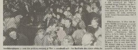
« Une nuit de liesse » : une des entrées menant à l'Est - vendredi soir - les Berlinois des deux côtés du mur se mêlent dans une cohue indisciplinée.

Plusieurs dizaines de milliers de Berlinois de l'Est commencent à célébrer la nuit, après la décision du gouvernement est-allemand d'ouvrir le mur de Berlin. Les Berlinois de l'Est ont célébré la nuit, après la décision du gouvernement est-allemand d'ouvrir le mur de Berlin.