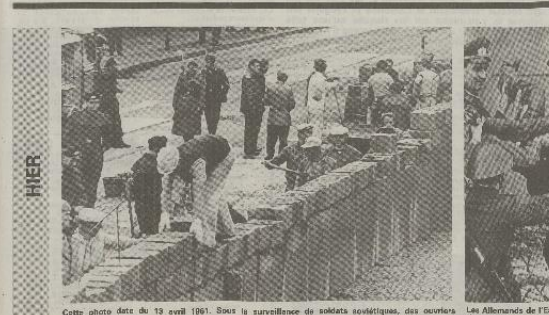
Un jeune homme, à Berlin-Est, brandit, tout souriant, le journal pratiquement vide que le mur est ouvert.